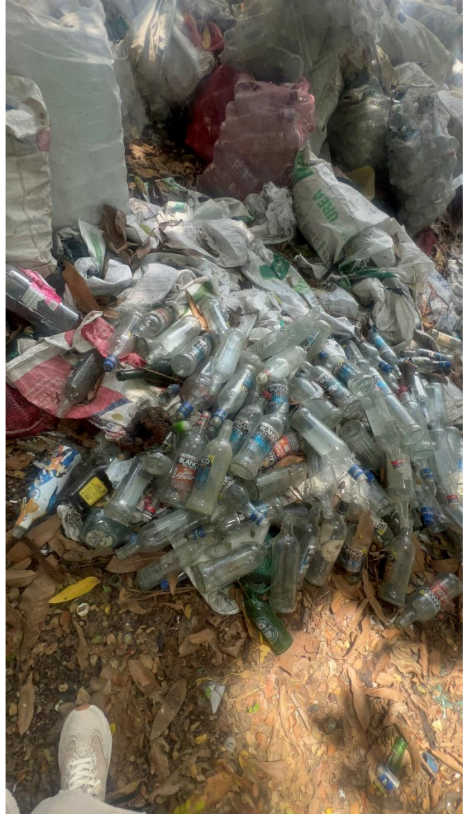
Foto tomada en visitas al bien inmueble en el municipio de Palmira Valle del Cauca FMI 378-85080