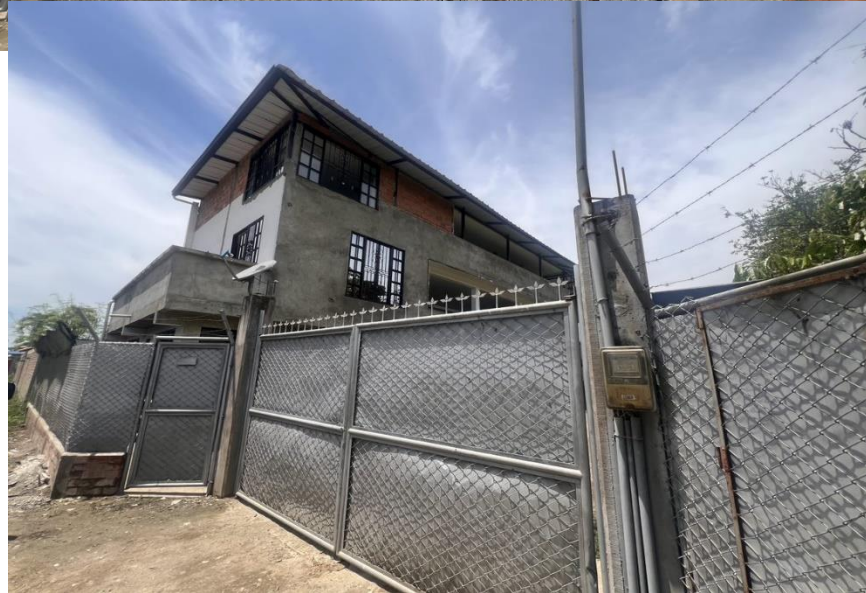
Foto tomada en visitas al municipio de Palmira al folio de matrícula 378-85080 Construcción nueva dentro del terreno incautado.

Foto tomada en visitas al bien inmueble en el municipio de Palmira Valle del Cauca FMI 378-85080