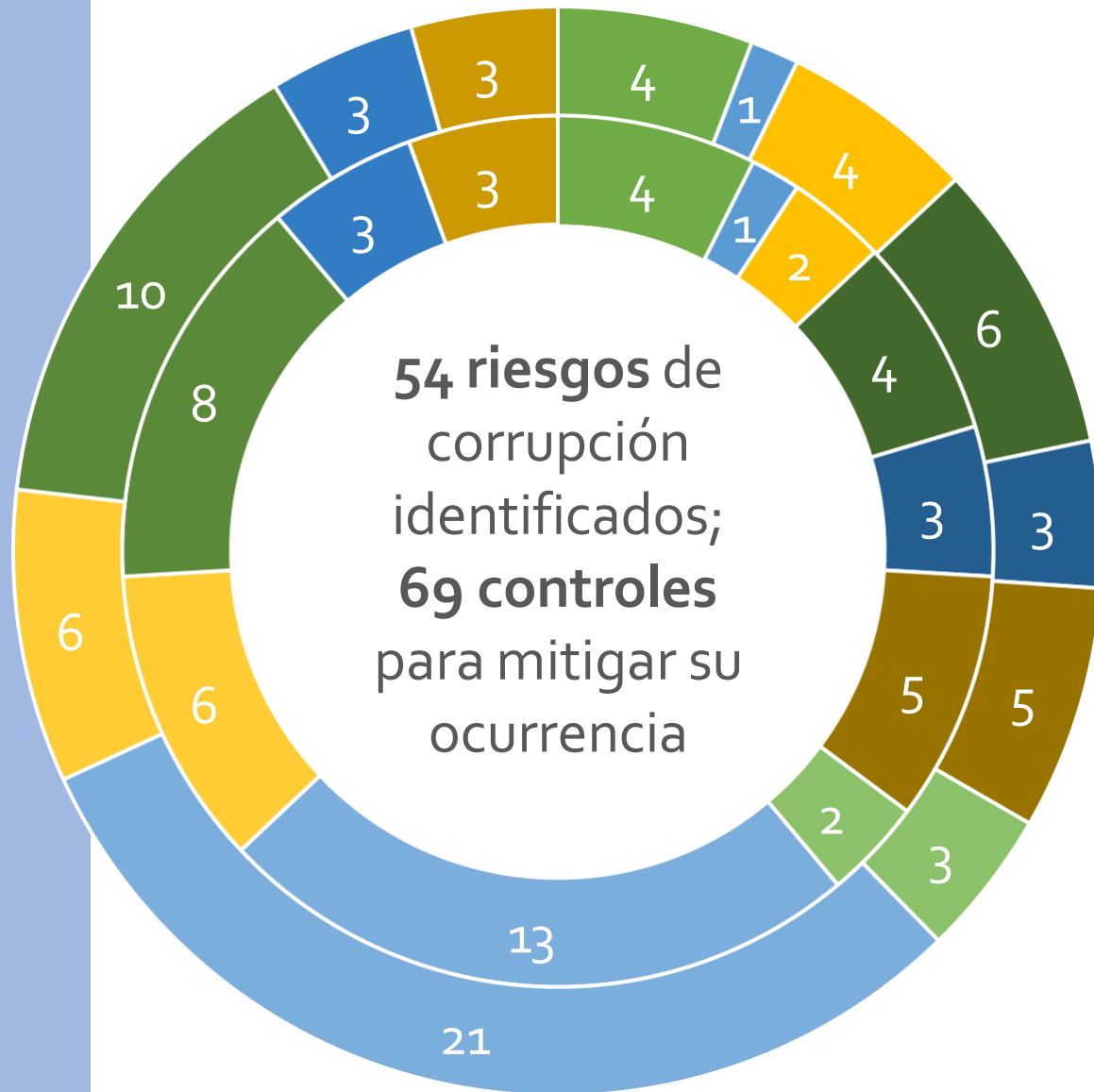
Relación de riesgos y controles y su representación porcentual por macroprocesos