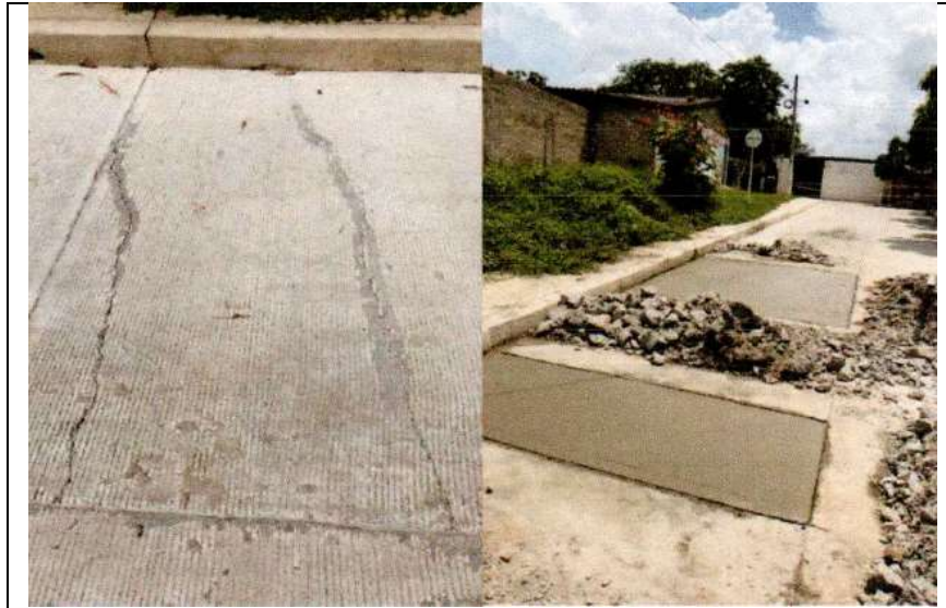
Informe técnico de reparación de losas fracturadas

Posteriormente se recibió informe técnico del supervisor del contrato identificado con sigedoc N°2020ER0063967 del 11 de julio/20, mediante el cual informó que se cumplió con el compromiso adquirido mediante acta N°002 del 2 de julio de 2020, en el sentido de efectuar las reparaciones técnicas necesarias para subsanar las deficiencias observadas por este organismo de control. En el referido informe se aportó el material fotográfico que muestra la demolición de las losas fracturadas, y la fundida de las nuevas losas, como se muestra a continuación: