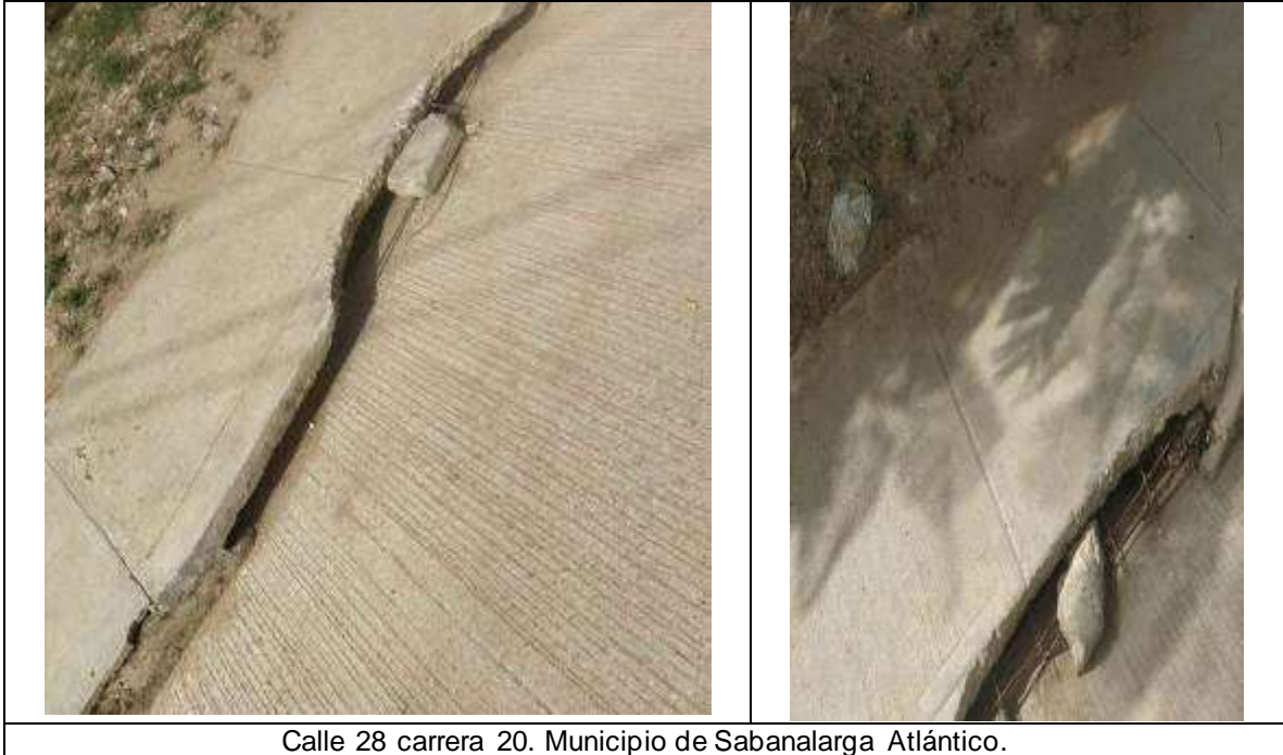
Calle 28 carrera 20. Municipio de Sabanalarga Atlántico.

Así las cosas, todas las patologías y deficiencias constructivas observadas disminuyen ostensiblemente la calidad de la obra y la capacidad de servicio de la estructura (vida útil), comprometiendo la calidad, estabilidad de la obra y generando un detrimento al patrimonio.