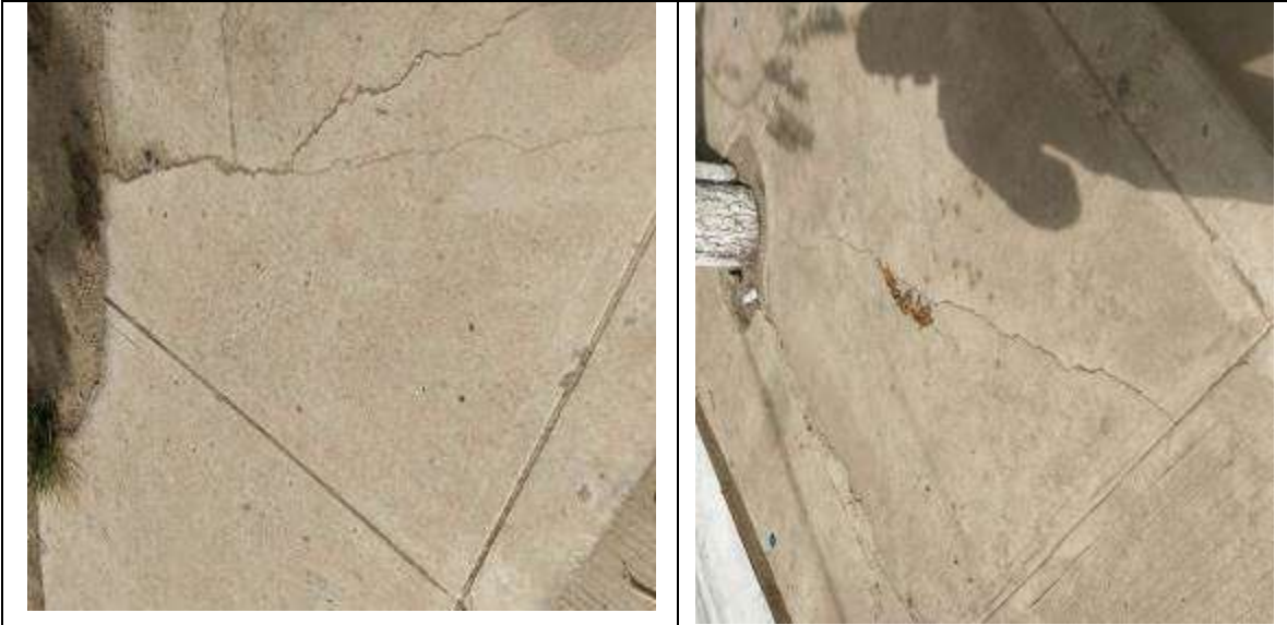
Calle 28 carrera 20. Municipio de Sabanalarga Atlántico.