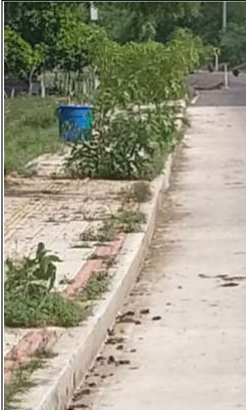
Calle 6 carrera 8 - Corregimiento de Villa Rosa – Repelón Atlántico