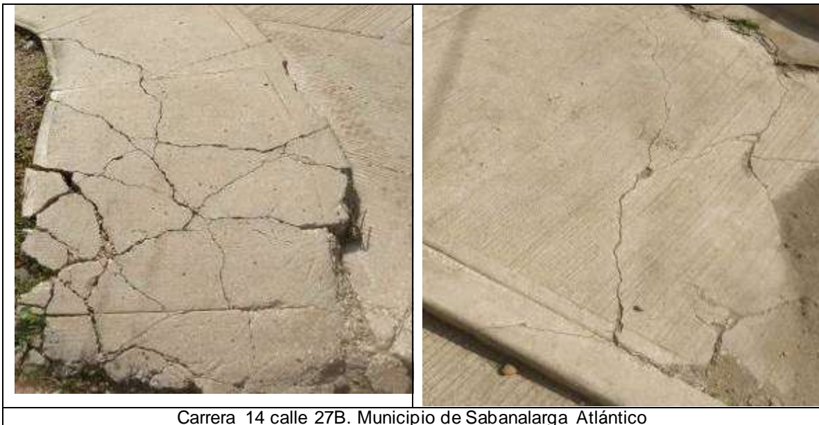
Carrera 14 calle 27B. Municipio de Sabanalarga Atlántico

Durante el recorrido, se observó mala calidad de obra en andenes y bordillos, tramos fracturados y con desgaste prematuro, situación que compromete la estabilidad de la obra construida, tal como se observa en el siguiente registro fotográfico: