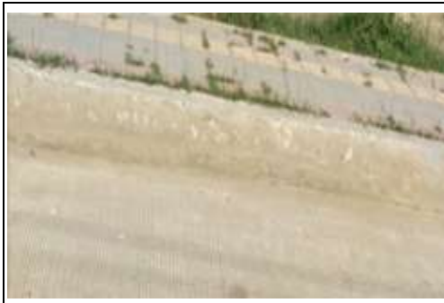
Carrera 14 calle 34 - San Estanislao de Kostka - Bolívar

Dentro de las actividades del contrato se encuentra la construcción de andén, con acabado en losetas prefabricadas, el mismo presenta en algunos tramos deficiencias constructivas, situación que permitió la inclusión de material orgánico que permite el enraizamiento de material vegetal, las plantas nacidas en el andén son evidencia de mala calidad de la obra, situación que también genera socavación de la base de las losetas y compromiso de la estabilidad de la obra construida, tal como se observa en el siguiente registro fotográfico: