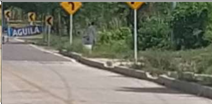
Calle 6 carrera 8 - Corregimiento de Villa Rosa – Repelón Atlántico