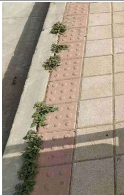
Carrera 14 calle 37 - San Estanislao de Kostka - Bolívar