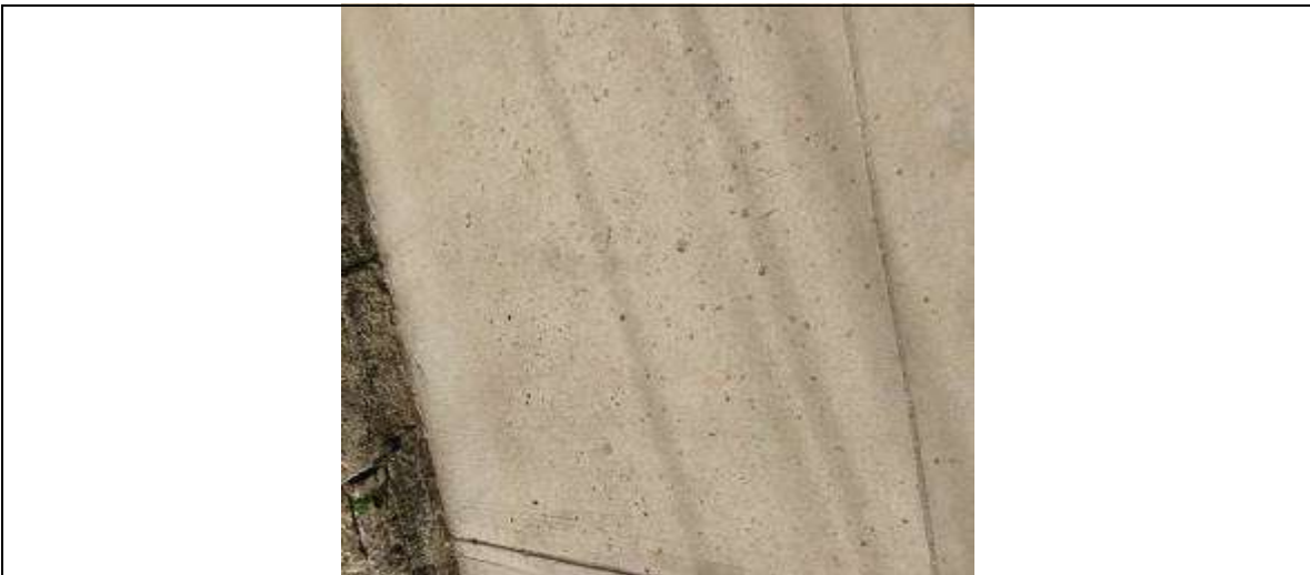
Calle 28 carrera 20. Municipio de Sabanalarga Atlántico.