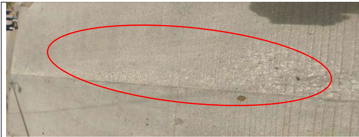
Calle 28 carrera 16B. Municipio de Sabanalarga Atlántico.

contenido de cemento, exceso de agua, agregados de inapropiada granulometría) o bien por deficiencias durante la ejecución de la obra (segregación de la mezcla, insuficiente densificación, curado defectuoso); otras de las posibles causas, puede ser la contaminación de la mezcla con material orgánico, entre otros; lo anterior para pavimentos diseñados con base en el manual de diseños de pavimentos de concreto para vías con bajos, medios y altos volúmenes de tránsito.