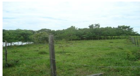
Árboles de resiembra afectada por presencia de ganado Predio Casa Roja – El Dorado -Meta

Adicionalmente, no se garantizan las labores de mantenimiento por parte de los propietarios a las reforestaciones establecidas, ni a los árboles producto de las resiembras efectuadas con ocasión de los mantenimientos realizados, una vez finalizado los respectivos contratos suscritos por la Corporación.