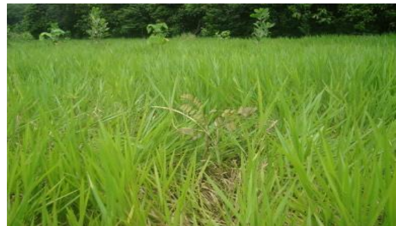
Reforestaciones establecidas en 2012 contrato 220-2011. Fincas La Marcela y La Estaca - San Juan de Arama - Meta