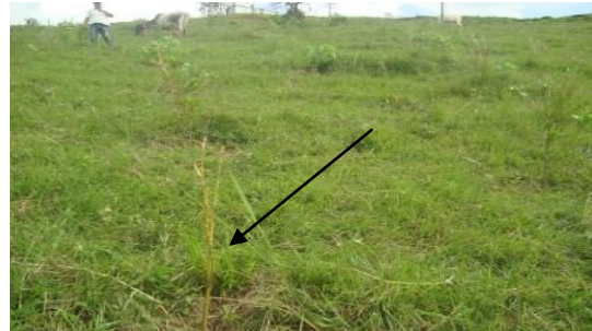
Árboles afectados por presencia de ganado Finca Los Naranjos – San Juan de Arama- Meta