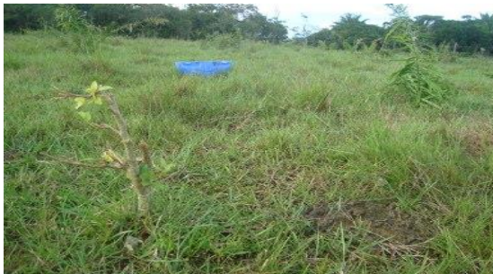
Árboles afectados por presencia de ganado Finca Yasnaya – Cubarral- Meta