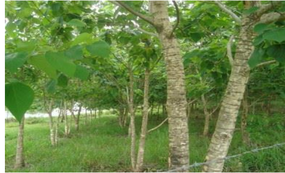
Árboles con altura superior a 4 y 5 metros, en predios La Flor del Llano y Casa Roja, El Dorado – Meta. Contrato 285-2011

En la respuesta dada por la Entidad se argumenta frente a lo descrito anteriormente: