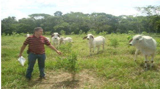
Presencia de ganado – árboles pequeños Finca Villa Alexandra – San Juan de Arama- Meta