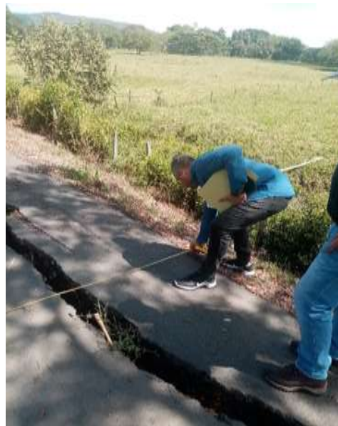
Referencia de profundidad, largo y ancho del asentamiento presentado

Luego de medir el asentamiento se observa que la falla es puntual y se presume que la calidad de la obra en cuanto a los materiales en este tramo presentó falencias, incumpléndose presuntamente de esta forma con las especificaciones generales de construcción de carreteras (INVIAS) actualizada mediante resolución N°003288 del 15 de agosto de 2007 para el constructor y el manual de interventoría (INVIAS) adoptado mediante resolución N°3009 del 13 de julio de 2007 en cabeza de la (F.U.V); Así mismo debe haberse seguido la guía metodológica