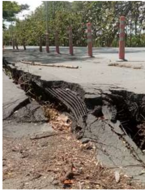
Mediciones del tramo de falla perfil del asentamiento presentado